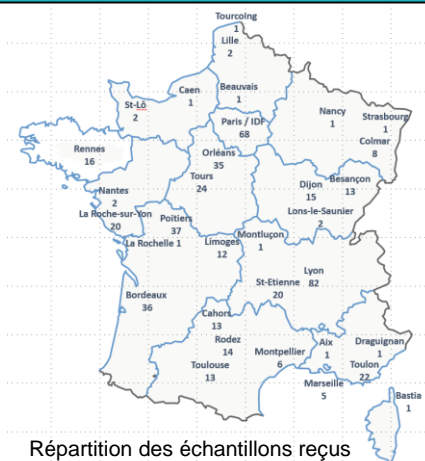
Répartition des échantillons reçus

La prévalence de la résistance aux fluoroquinolones était de 17,1% (67/392), avec 25,8% chez les hommes (41/159) vs 10,8% chez les femmes (25/232) (p<0,001). Les mutations Ser83Ile, Asp87Tyr, Asp87Asn, Ser83Arg et Gly81Cys ont été retrouvées (numérotation M. genitalium ).